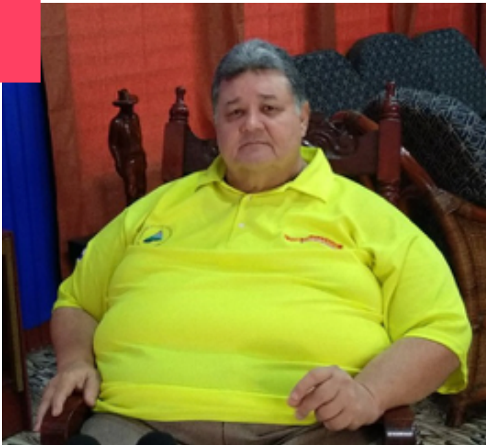
Candidato a diputado nacional por el FSLN.