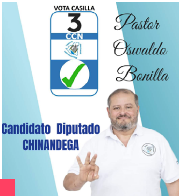
Candidato a diputado por Camino Cristiano en Chinandega.

Pastor evangélico de una iglesia, es el director de una clínica y una farmacia en Chinandega. Es aliado del FSLN y la Alcaldía le destina dinero a este pastor, que es parte del fondo que se destina a las iglesias evangélicas. Acompaña a la alcaldesa del FSLN a orar por las calles de Chinandega y otras actividades. Este candidato inscribió a su familia (hijos/as y esposa) como candidatos/as a diputados propietarios, suplentes y al Parlamento Centroamericano.