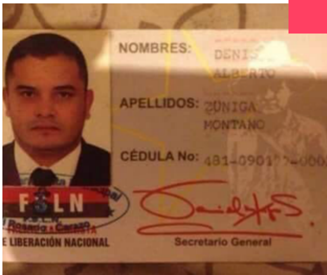
Candidato a diputado por ALN en el departamento de Nueva Segovia.