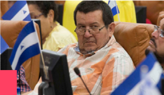
Candidato a diputado por el FSLN en Boaco.

Radica en Camoapa, ya tiene dos períodos de ser diputado y es una de las personas que apoyó la represión en mayo del 2018 en la comunidad del Quebracho, Teustepe, donde turbas orteguistas llegaron en seis camionetas al tranque de esa comarca y empezaron a disparar y atacar, hubo un fallecido.