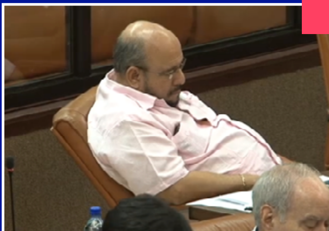
Candidato a diputado en el departamento de Managua.