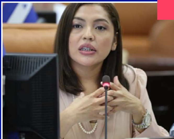
Candidata a diputada por el FSLN en Masaya.

Tiene tres períodos en la asamblea, es ahijada de Ortega.