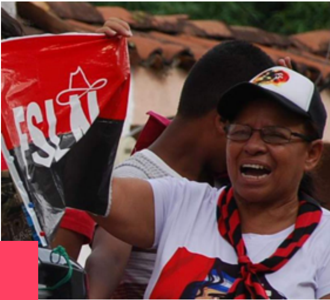
Candidata a diputada por el FSLN en Nueva Segovia.