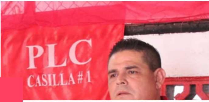
Candidato a diputado por el PLC en el departamento de Masaya.