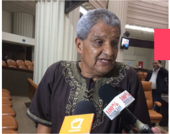
Candidato a diputado regional en la Costa Caribe Norte por YATAMA.

Ha estado en la política desde 1979 con su integración en la Alianza para el Progreso de los Miskito y Sumu, fue preso político durante los años ochenta, por su oposición al régimen de Daniel Ortega. Luego fundó una de las facciones que fue parte de La Contra en la Costa Caribe llamada MISURASATA.