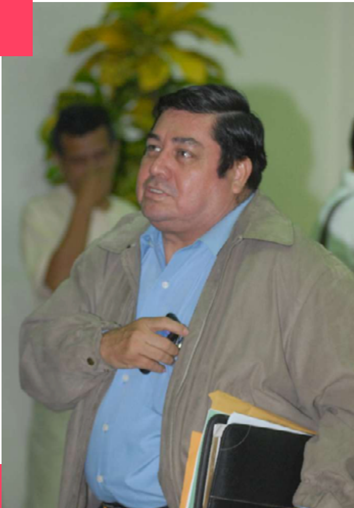
Candidato a presidente por CCN.

Se le atribuyeron un total de 16 de casos de venta ilegal de propiedades junto a otras personas vinculadas al partido indígena Yatama. Luego, las ventas fueron anuladas por la PGR y correspondían a un total 155 mil