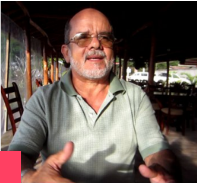
Candidato a diputado por el FSLN en Jinotega.

Es presidente del Consejo Nacional del Café, una organización encargada de supuestamente apoyar a productores de café. Tiene muchísima influencia y control sobre grupos de productores cafetaleros. Es testaferro de Daniel Ortega. Atacó al Movimiento Campesino, señalándoles de ser “grupos de extrema derecha”.