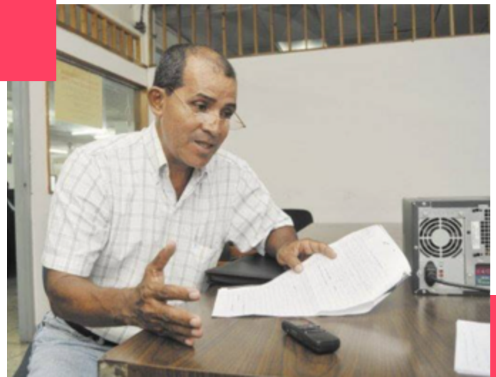
Candidato a diputado nacional por el FSLN.

En septiembre del 2015, Osorno fue acusado por las autoridades de la Procuraduría General de la República (PGR) por verse involucrado como notario en actos relacionados con los territorios comunitarios de la Costa Caribe al