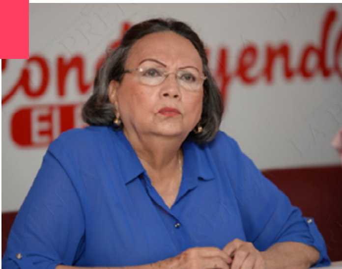
Candidata a diputada nacional por el PLC.

Actualmente es diputada, como presidenta nacional (lleva más de diez años) y representante legal del Partido Liberal Constitucionalista PLC, ha sido una de las responsables de destituir de sus cargos y expulsar de las filas de su partido a las personas que se oponían a su dirigencia o que podían cuestionar su alianza con el FSLN.