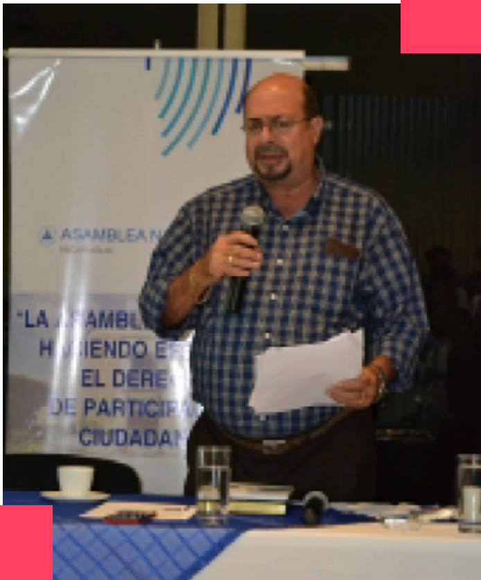
Candidato a diputado por el FSLN en Masaya.

También este candidato ha llegado a justificar el despliegue de parapolicías, diciendo que su presencia no afectaba el turismo en Nicaragua. 7