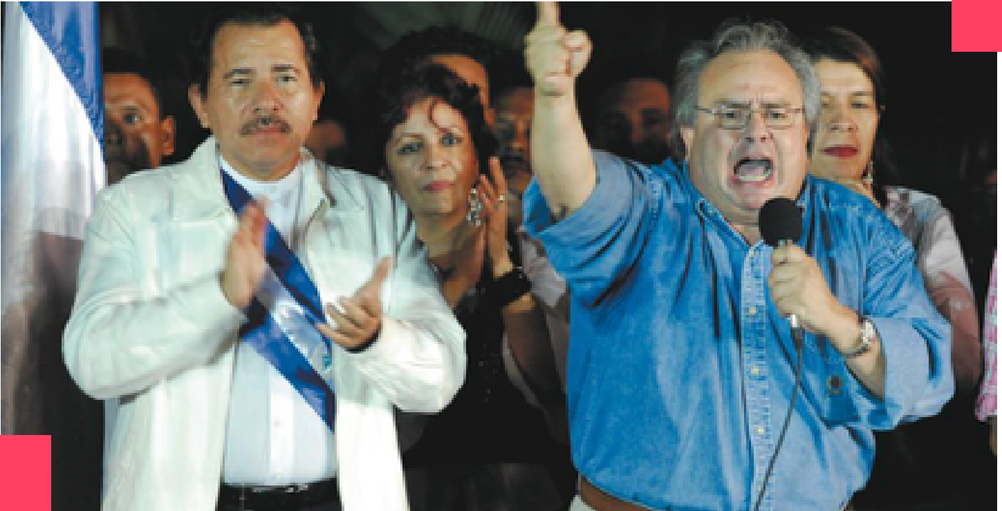
Candidato a diputado nacional por el FSLN.

Gustavo Porras es Presidente de la Asamblea Nacional, secretario general de la Federación de Trabajadores de la Salud (FETSALUD) y dirigente del Frente Nacional de los Trabajadores (FNT).