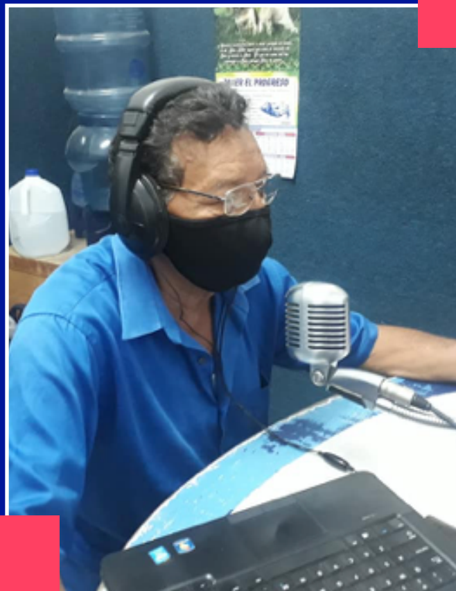
Candidato a diputado por APRE en Granada.

Locutor en Radio volcán, conocido por ser simpatizante del FSLN.