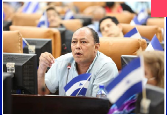
Candidato a diputado León por el FSLN.

Fue partícipe de las agresiones a estudiantes en la ciudad de León y fue grabado realizando amenazas a la ciudadanía que se manifestó durante las protestas del año 2018. 10 Fue acusado por el propietario de Radio Darío, Aníbal Toruño, de quemar esa radio el 20 de abril de ese mismo año.