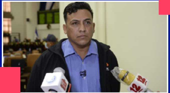
Candidato a diputado por el PLC en Chinandega.

Ha sido candidato a alcalde por el municipio de Chinandega. Es abogado, se desenvuelve como defensor de hombres acusados de violación y acoso sexual. Es diputado del PLC y se presenta como director de una Comisión de derechos humanos cuya sede está en Managua.