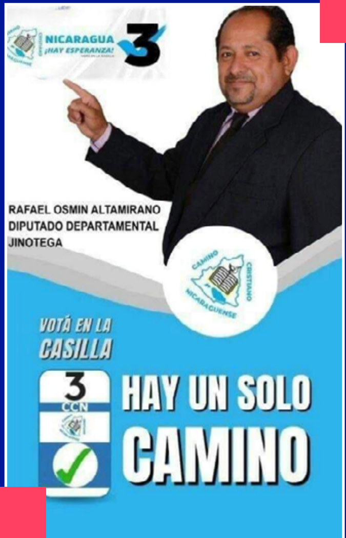
Candidato a diputado por el Partido Camino Cristiano en Jinotega.

Es pastor evangélico y concejal propietario del partido FSLN, esta información puede verificarse en la lista de ciudadanos electos en las elecciones municipales del año 2017 2 , se publicó en La Gaceta en noviembre del mismo año. Actualmente está inscrito como candidato a diputado por el Partido Camino Cristiano Nicaragüense.