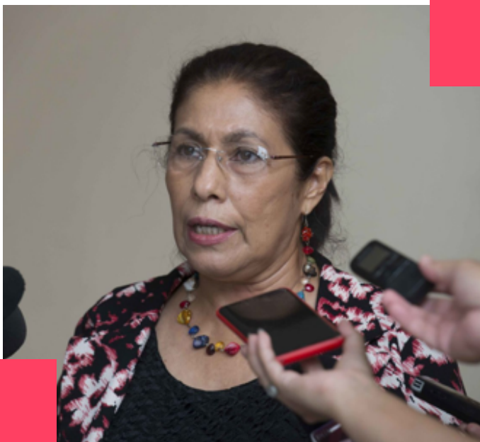
Candidata a diputada por el FSLN en Granada.

Diputada de Granada desde el año 2011, este sería su tercer periodo consecutivo. Es abogada y una de las personas que toma decisiones en el partido del FSLN en Granada, incluso tiene más poder de decisión que el alcalde.