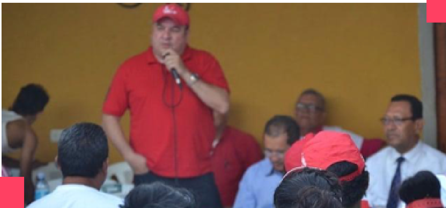
Candidato a diputado por ALN en el departamento de Managua.