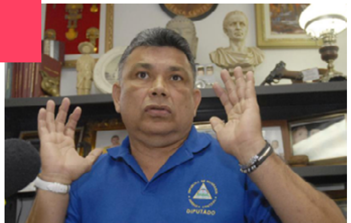
Candidato a diputado nacional por el FSLN.

Debutó en la política como opositor y crítico acérrimo a Daniel Ortega. En una entrevista del año 2010 dijo que sería un opositor al Frente Sandinista hasta su muerte. Proveniente de una familia somocista, también fue preso político en los años 80.